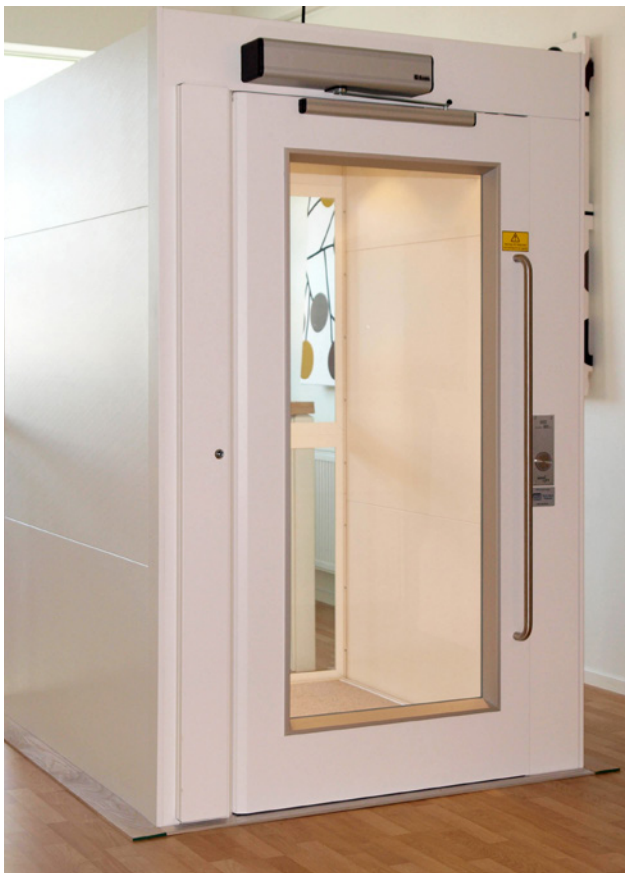
Plattformaufzug mit großer Glasdrehflügeltür