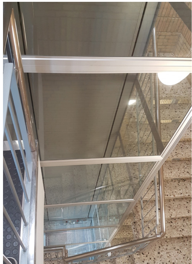
Plattformaufzug im Glasschacht

Hinweis: Technische Informationen zu unseren Plattformaufzügen finden Sie auf der Rückseite dieser Broschüre. Sollten Sie darüber hinaus Interesse an unseren Güter-Plattformaufzügen haben, sprechen Sie uns jederzeit gerne an!